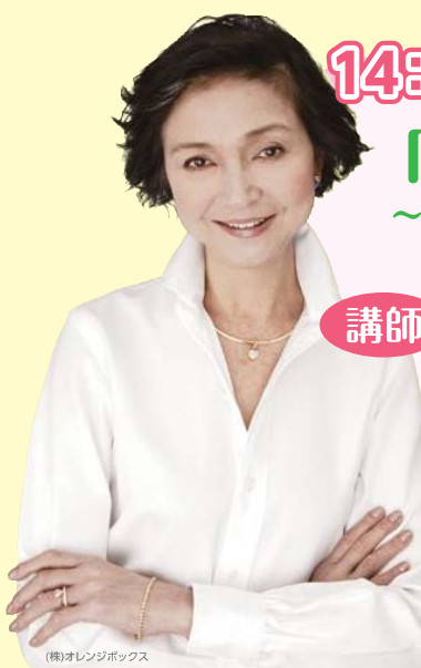
(株)オレンジボックス